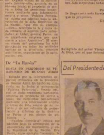
«PALABRA PERONISTA», en su primer número, se expresa con claridad la adhesión de la Asamblea del Movimiento y del Ejército de la Libertad, en la medida que el pueblo argentino, en su totalidad, se encuentra en condiciones de comprender y aceptar el programa peronista...