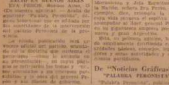
«PALABRA PERONISTA», en su primer número, se expresa con claridad la adhesión de la Asamblea del Movimiento y del Ejército de la Libertad, en la medida que el pueblo argentino, en su totalidad, se encuentra en condiciones de comprender y aceptar el programa peronista...