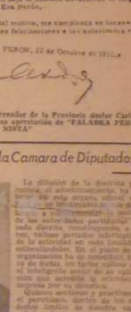
«PALABRA PERONISTA», en su primer número, se expresa con claridad la adhesión de la Asamblea del Movimiento y del Ejército de la Libertad, en la medida que el pueblo argentino, en su totalidad, se encuentra en condiciones de comprender y aceptar el programa peronista...