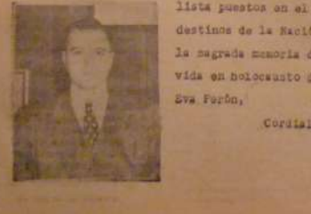
«PALABRA PERONISTA», en su primer número, se expresa con claridad la adhesión de la Asamblea del Movimiento y del Ejército de la Libertad, en la medida que el pueblo argentino, en su totalidad, se encuentra en condiciones de comprender y aceptar el programa peronista...