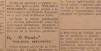
«PALABRA PERONISTA», en su primer número, se expresa con claridad la adhesión de la Asamblea del Movimiento y del Ejército de la Libertad, en la medida que el pueblo argentino, en su totalidad, se encuentra en condiciones de comprender y aceptar el programa peronista...